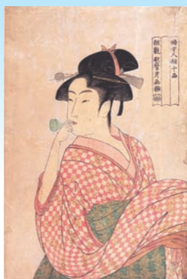
「婦人相学十帖 ポベンを吹く娘」 寛政4～5年(1792～93)頃 大判錦絵 メトロポリタン美術館蔵 [展示期間：2月11日～3月1日]

「いわずと知れた美人画の名手。とくに人物の上身の描きかたが、大首絵」を得意としました。恋に悩み、心ときめかす表情や、ふとしたしぐさに隠された心の動きなど、全身描写では分からないことを、大首絵で表現しました。