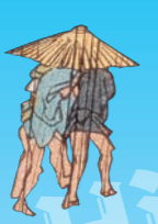
「名所江戸百景 大はしあたけの夕立」 安政4年(1857)9月 大判錦絵 東京都江戸東京博物館蔵 [展示期間：1月26日～2月24日]

豊かな発想で次々とアイデアを出し続け、幕末の浮世絵界を活性化させた絵師。特に勇壮な武者絵や、三枚続の画面にワイドに展開する歴史画や動物を擬人化させて描く戯画は、時代を超えて現代人にも高く評価されています。