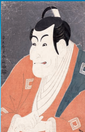
「市川團藏の竹村定之進」 寛政6年(1794)5月 大判錦絵 ホスト美術館蔵 [展示期間：1月28日～2月24日]

寛政6年(1794)、黒雲母摺りの役者大首絵28枚によりデビューを果たすも、ほどなくして筆を置いた、謎多き絵師。役者の顔を誇張した描写は前例のないもので、浮世絵界に衝撃を与えました。