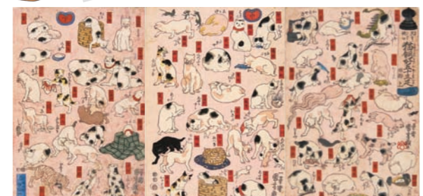
「其ま、地口猫飼好五十三正」 嘉永元年(1848)頃 大判錦絵3枚続 [展示期間：1月28日～2月24日]

豊かな発想で次々とアイデアを出し続け、幕末の浮世絵界を活性化させた絵師。特に勇壮な武者絵や、三枚続の画面にワイドに展開する歴史画や動物を擬人化させて描く戯画は、時代を超えて現代人にも高く評価されています。