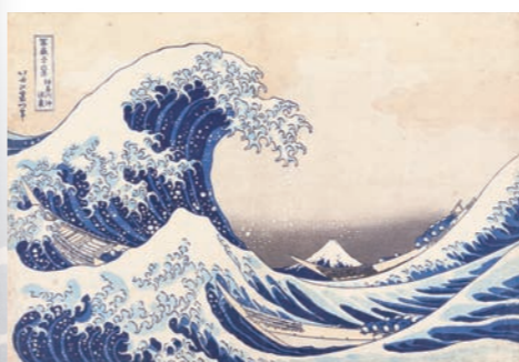
「富嶽三十六景 神奈川沖浪裏」 天保2～4年(1831-33)頃 大判錦絵 ミネアポリス美術館蔵 [展示期間：1月28日～2月24日]

90年の生涯のうち、70年にわたって浮世絵のすべてのジャンルにおいて第一線で描き続けた巨人。「富嶽三十六景」をはじめとする、70代前半の風景画を中心とした錦絵の連作は、洋風画学習の成果や、動感と緊張感に富む構図など、それまでの試みや経験が見事に開花しています。