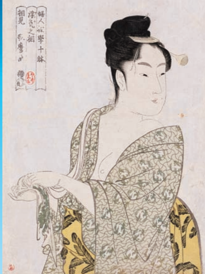
「婦人相学十帖 浮気之相」 寛政4～5年(1792～93)頃 大判錦絵 メトロポリタン美術館蔵 [展示期間：1月28日～2月24日]

「いわずと知れた美人画の名手。とくに人物の上身の描きかたが、大首絵」を得意としました。恋に悩み、心ときめかす表情や、ふとしたしぐさに隠された心の動きなど、全身描写では分からないことを、大首絵で表現しました。