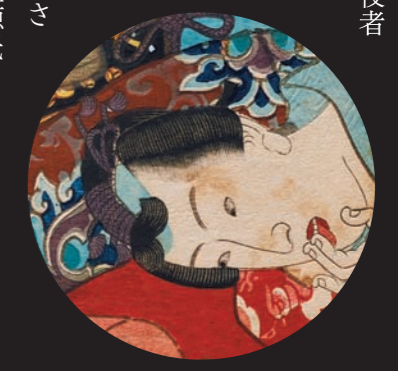
「正寫相生源氏」(部分) 嘉永4年(1851)頃