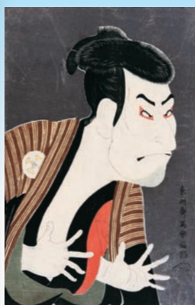
「3代目大谷鬼次の江戸兵衛」 寛政6年(1794)5月 大判錦絵 シカゴ美術館蔵 [展示期間：1月28日～3月22日]

寛政6年(1794)、黒雲母摺りの役者大首絵28枚によりデビューを果たすも、ほどなくして筆を置いた、謎多き絵師。役者の顔を誇張した描写は前例のないもので、浮世絵界に衝撃を与えました。