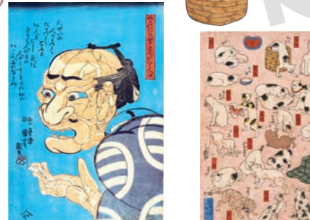
「みかけハこハあがとんだい、人だ」 弘化4年(1847)頃 大判錦絵 [展示期間：2月26日～3月22日]