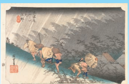
「東海道五拾三次之内 庄野 白雨」 天保5～7年(1834～36)頃 大判錦絵 東京都江戸東京博物館蔵 [展示期間：2月26日～3月22日]

若い頃は多彩なジャンルの作をこなしましたが、北斎の「富嶽三十六景」に刺激を受けてか風景画を描きはじめ、「東海道五拾三次之内」以降、各地の名所や宿場に取材し、それを抒情的で風情のある図に仕立てる名人として名を馳せました。