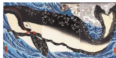
「宮本武蔵の鯨退治」 弘化4年(1847)頃 大判錦絵3枚続 [展示期間：1月28日～2月24日]