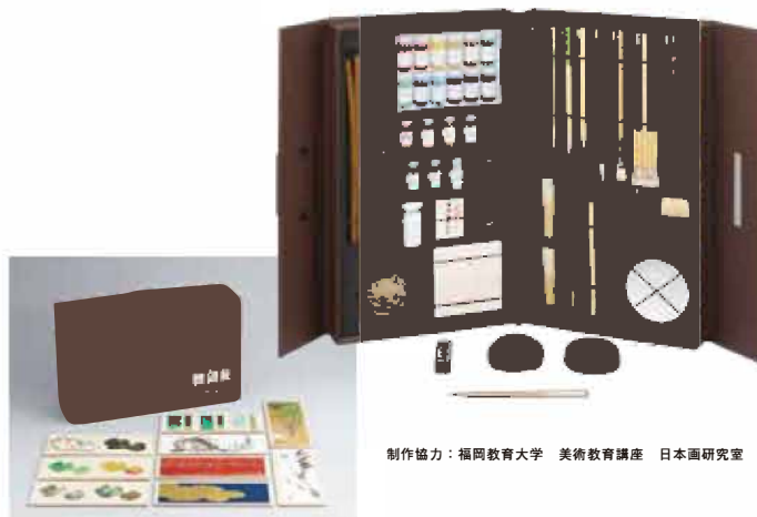
制作協力：福岡教育大学 美術教育講座 日本画研究室