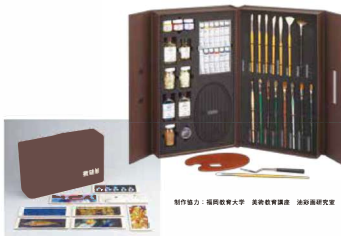
制作協力：福岡教育大学 美術教育講座 油彩画研究室