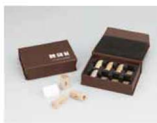
③ 制作協力：福岡教育大学 美術教育講座