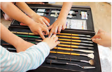
触ってみると特徴がよくわかるよ。