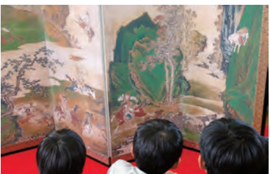
何が描かれているかな？皆で話してみよう。

教材は図画工作科・美術科以外にも社会科や家庭科、総合的な学習、生活単元学習などの関連する教科でも工夫してお使いいただけます。 各教材には、教材の内容を説明した解説シートが付属しています。