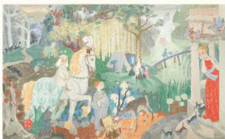
※映像で紹介予定です。

ムーミンと仲間たちの物語は、出版から80年を経た今も世界中の人々の心をとらえています。会場では、物語の一場面や、保育園のために描かれた壁画の映像演出もお楽しみいただけます。