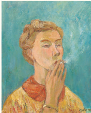
「煙草を吸う娘(自画像)」 1940年 油彩、カンヴァス 個人蔵 © Tove Jansson Estate

画家志望だったトーベは、油彩画や病院、保育園などの壁画にも取り組みました。本展では、トーベの絵画作品を始め、これまであまり知られていなかった壁画制作をフィンランドでの最新の研究成果をもとに紹介します。