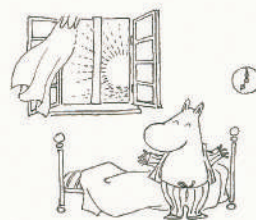
「おはよう」 制作年不詳 インク、紙 ムーミンキャラクターズ コレクション © Moomin Characters™