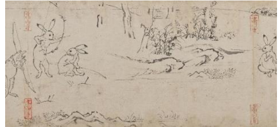
《鳥獣人物戯画 甲巻》(部分) (国宝) 平安時代 12世紀 京都・高山寺蔵

本展では、《鳥獣戯画》の魅力を支える、動物モチーフと表現の簡潔さとユーモア、というテーマに沿って、日本美術を紹介します。