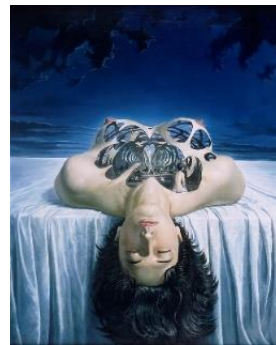
藤野一友《抽象的な籠》1964年

藤野一友（1928-80）と岡上淑子（1928年生まれ）は戦後、シュルレアリスムを受容しながら、それぞれ絵画とフォトコラージュという分野で独自の作品世界を生み出しました。1951年ごろ文化学院で出会った藤野と岡上は、1957年に結婚。同じ時代に活動を開始した2人の作品には、身体の表象や幻想的な世界観に共通点も見出せます。藤野と岡上の活動に迫ります。