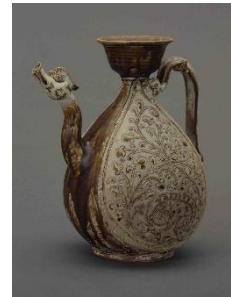
《白褐釉刻花龍鳳凰文水注》 タイ 15世紀 本多コレクション