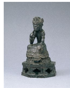
《菩薩半跏思惟像》 飛鳥～奈良時代 7～8世紀