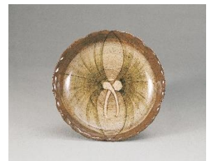
《現川刷毛地色絵抱銀杏文輪花皿》 江戸時代17～18世紀 田中丸コレクション