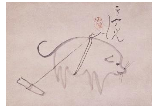
仙厓義梵《犬図》 江戸時代 19世紀