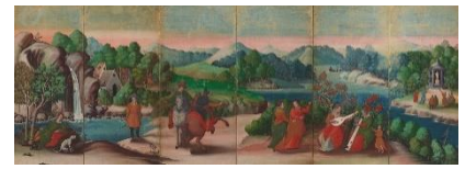
《泰西風俗図屏風》(右隻) (重要文化財) 桃山-江戸時代 17世紀

屏風は、間仕切りや風除けなど、室内装飾として欠かせない調度品でした。屏風絵ならではの大きな画面に描かれた迫力ある表現や、折ることによって生まれる立体感をお楽しみください。