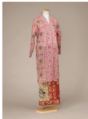
上衣 1910-1920年代、腰衣 1890年頃