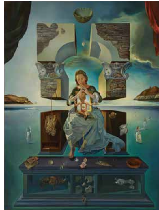
© Salvador Dalí, Fundació Gala-Salvador Dalí, JASPAR Tokyo, 2019 G1699