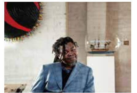
インカ・ショニバレCBE