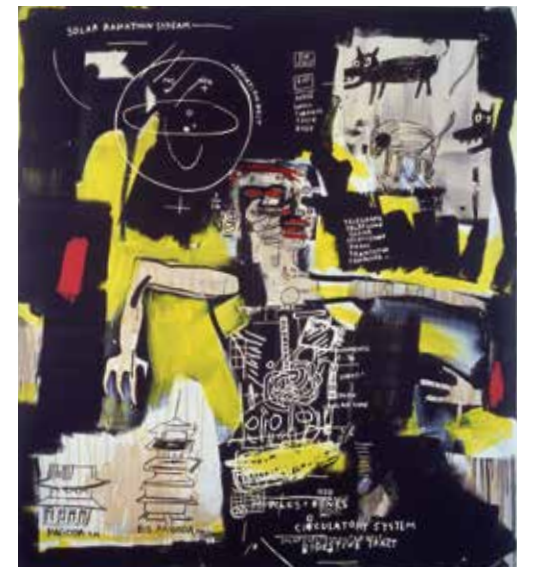
©The Estate of Jean-Michel Basquiat / ADAGP, Paris & JASPAR, Tokyo, 2019 G1699

ジャン=ミシェル・バスキア 《無題》1984年 Jean-Michel Basquiat "Untitled" 1984