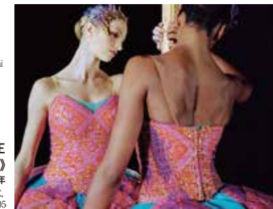
Copyright Yinka Shonibare CBE. Courtesy Stephen Friedman Gallery, London; James Cohan Gallery, New York and Goodman Gallery, Johannesburg and Cape Town.

インカ・ショニバレCBE 《オディールとオデット》 2005年 Yinka Shonibare CBE, Odile and Odette, 2005