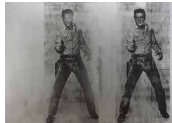
©2019 The Andy Warhol Foundation for the Visual Arts, Inc./ Licensed by ARS, New York & JASPAR, Tokyo G1699