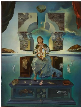
サルバドール・ダリ 《ポルト・リガトの聖母》