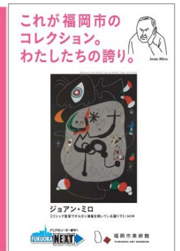
(フラッグイメージ)