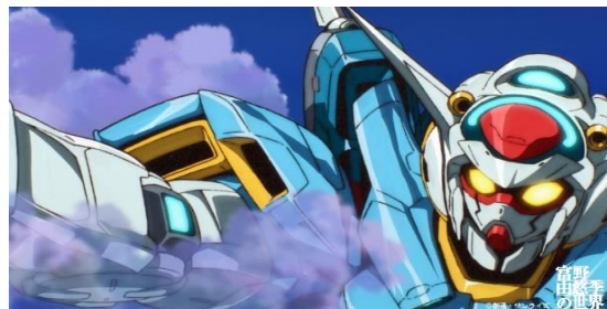
⑥「ガンダムGのレコンギスタ」