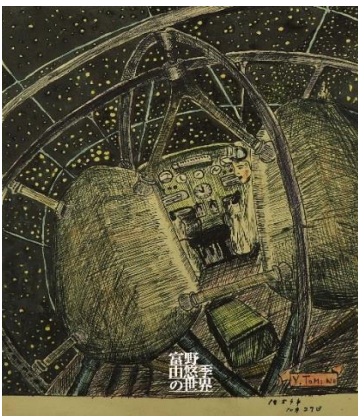
③「宇宙船コックピット」(富野由悠季、1954年) ©オフィスアイ

① ©手塚プロダクション・東北新社 ©東北新社 ©サンライズ ©創通・サンライズ ©サンライズ・バンダイビジュアル・バンダイチャンネル ©SUNRISE・BV・WOWOW ©オフィスアイ