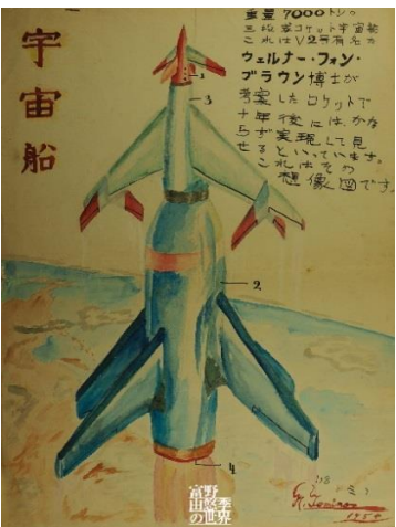
⑤「宇宙船」(富野由悠季、1954年)