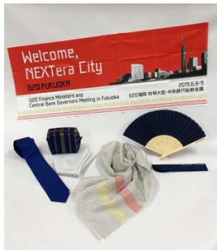
← 記念品一覧 （上から時計回りに手ぬぐい、扇子、ストール、ネクタイ、ポケットチーフ、ポーチ）