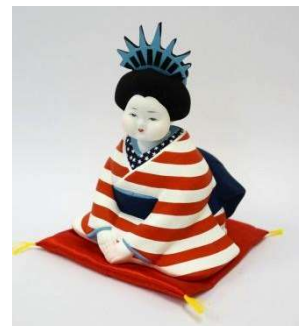
↑ 完成した作品の一例（米国）