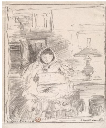
② 《アレクサンドリーヌ・デュルー》