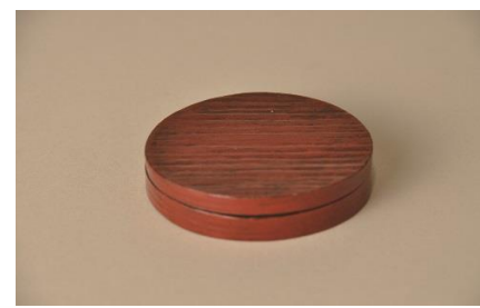
8 仙厓義梵作《日の丸香合》