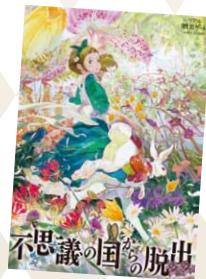
Illustration by SHINOMIYA YOSHITOSHI ©SCRAP