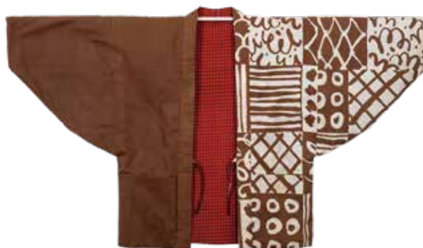
藤田嗣治《片身替袴織》メゾン=アトリエフジタ、エソンス蔵