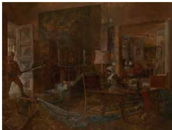
藤田嗣治《神兵の救出到る》1944年 東京国立近代美術館蔵(無期限貸与作品) © Fondation Foujita / ADAGP, Paris & JASPAR, Tokyo, 2020 G2292