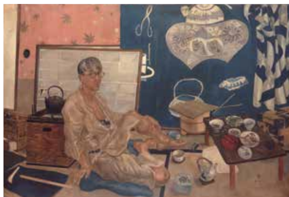
藤田嗣治《自画像》1936年 公益財団法人平野政吉美術財団蔵 © Fondation Foujita / ADAGP, Paris & JASPAR, Tokyo, 2020 G2292

〒810-0051 福岡市中央区大濠公園 1-6 TEL 092-714-6051 / FAX 092-714-6071 https://www.fukuoka-art-museum.jp/