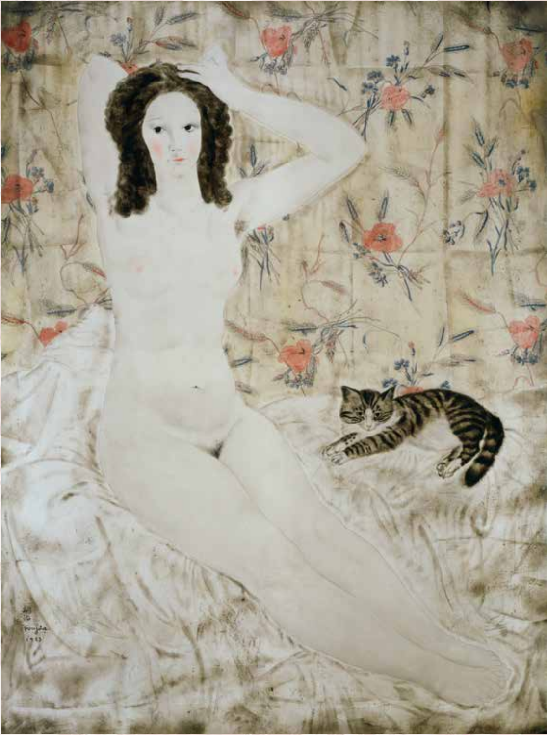
藤田嗣治《タビスリーの裸婦》1923年 京都国立近代美術館蔵 © Fondation Foujita / ADAGP, Paris & JASPAR, Tokyo, 2020 G2292