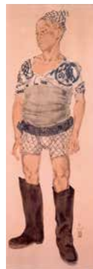
藤田嗣治《魚河岸》1934年 下関市立美術館蔵 © Fondation Foujita / ADAGP, Paris & JASPAR, Tokyo, 2020 G2292