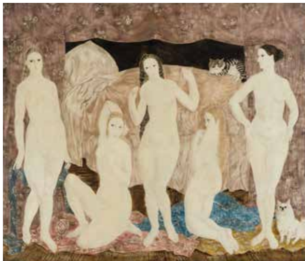
藤田嗣治《五人の裸婦》1923年 東京国立近代美術館蔵 © Fondation Foujita / ADAGP, Paris & JASPAR, Tokyo, 2020 G2292