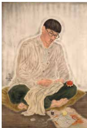
藤田嗣治《自画像》1929年 ポーラ美術館蔵

一方、画家として世に出る前から、布に並々ならぬ関心を寄せていた藤田は、布を集めるだけでなく、針仕事にも熱心であったことが知られています。本展ではここにも注目し、彼が収集した布や、自ら製作した衣服や小物を展示します。藤田のフランスでの生活、日本への思いを、彼の針仕事から読み解きます。