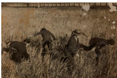
① 《イルフ逃亡》※本展メインビジュアル