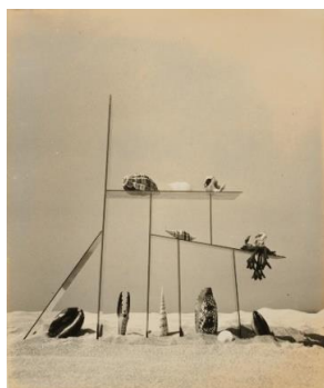
④ 《海のショーウィンドウ》