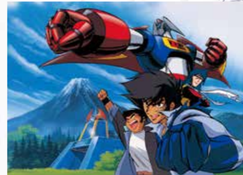
本編物語を牽引する劇中スーパーロボアニメ『ゲキ・ガンガー3』 『機動戦艦ナデシコ』（1996年）