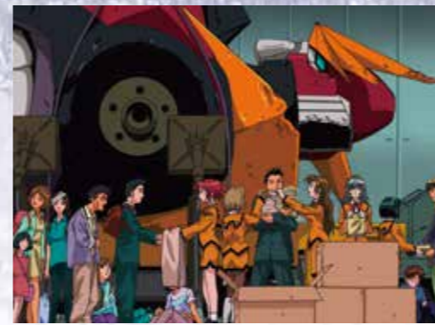
スーパーロボットは会社の備品 『地球防衛企業ダイ・ガード』（1999年）

宮武一貴氏（スタジオぬえ）が、巨大ロボットをテーマとした描きおろしの巨大絵画を本展のために制作しました。美術館ならではの大幅な画面で、宮武氏の描くロボットワールドを堪能してください！