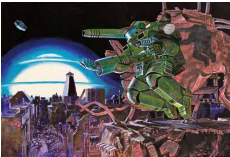
加藤直之・宮武一貴(宇宙の戦士)(1977年) ©スタジオぬえ

西日本新聞イベントサービス内「日本の巨大ロボット群像展」係 TEL:092-711-5491(平日9:30～17:30)