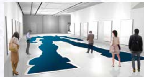
あの有名ロボットを劇中の設定サイズで体感できる！