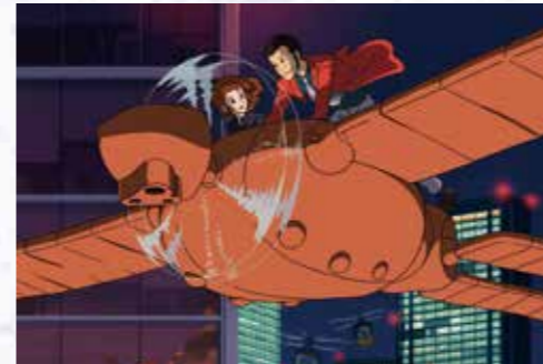
ルパン三世に登場するロボット兵・ラムダ 『ルパン三世 PART2』（1977年）第155話 さらば愛しきルパンよ 原作：モンキー・パンチ