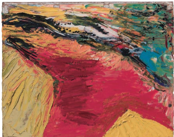
《題不詳》1963-64年頃 油彩・画布 オチ・オサム事務所蔵

美術館初の回顧展となる今回、オチが残した作品等の調査に基づき、これまで十分に光の当たらなかったオチ・オサムの全貌をご覧ください。