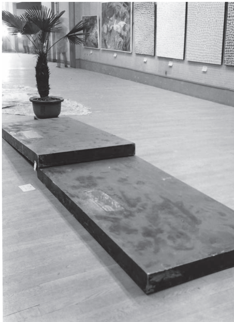
《出口ナシ》1962年 木、油性塗料、ガラス、セメント (第14回読売アンパダン展) [東京都美術館] 展示風景