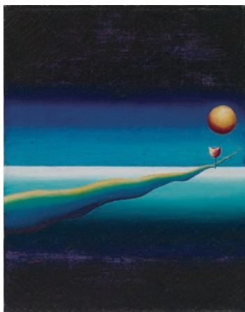
《題不詳》1973年 油彩・画布 オチ・オサム事務所蔵