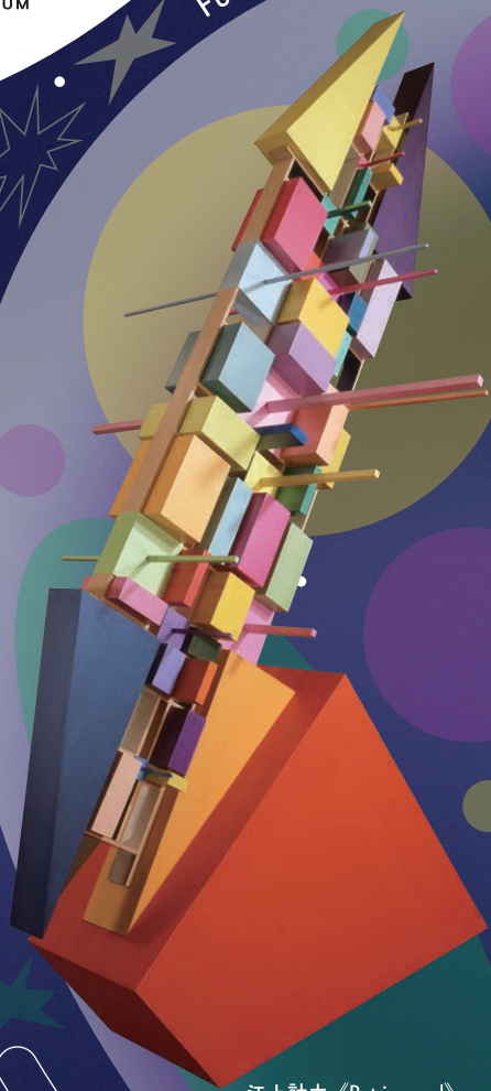
江上計太 《Patrio-scud》 2003年（1991年着想）

Fukuoka Art Museum Children's Art Museum during Summer Vacation 2026